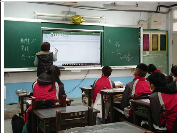
說明：數學老師教學生讀取統計圖表，並利用試算表的加總函數及公式計算。