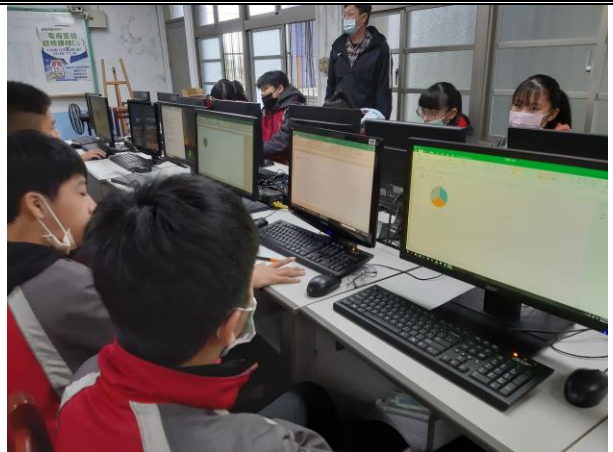
說明：資訊課老師指導學生運用試算表統計圖表功能，產出圓形圖及百分比。