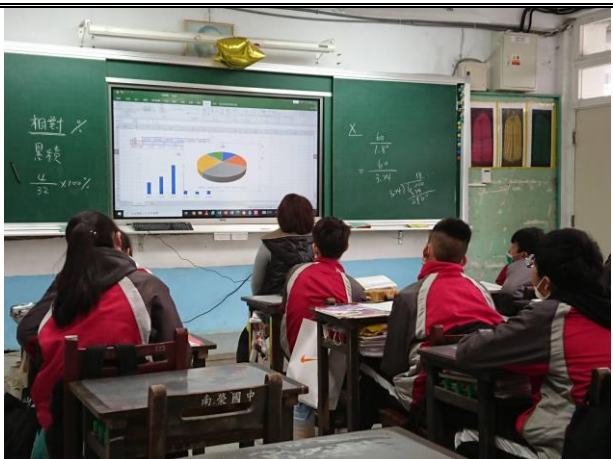
說明：老師鼓勵學生去嘗試該軟體的多樣功能，並用以完成課本上的範例。