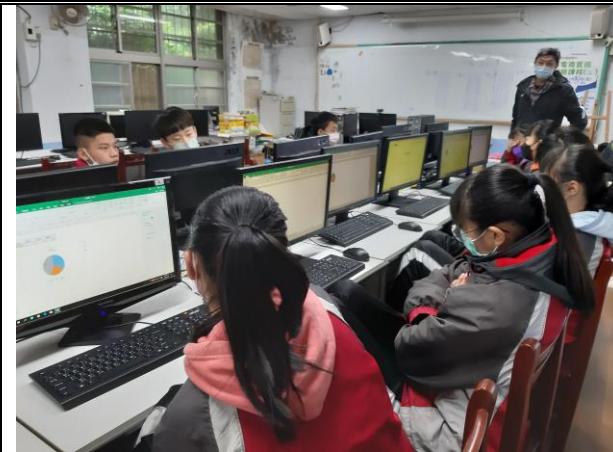
說明：資訊課老師教導學生試算表軟體的主要功能及在生活上的運用。